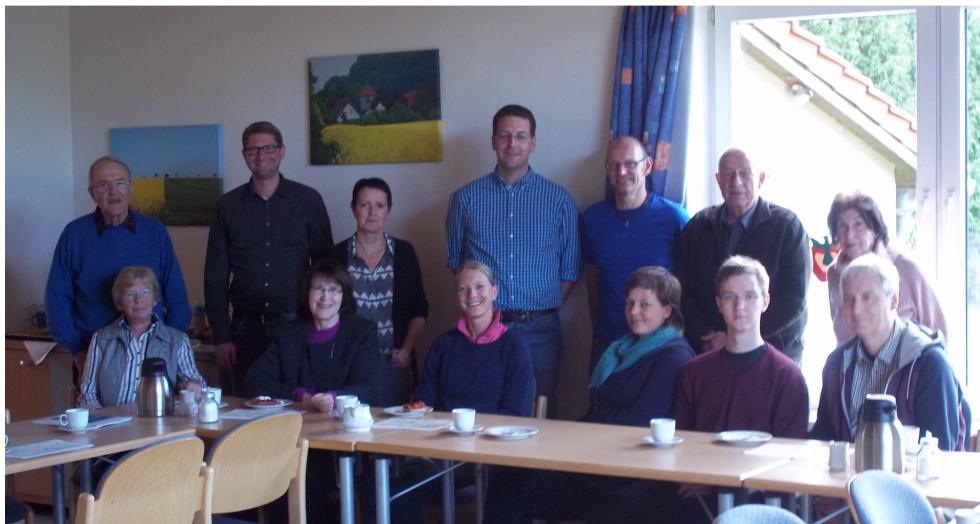
Nach der Ortsbegehung wurde bei Kaffee und leckerem selbst gebackenen Kuchen im Volzumer Dorfhaus weiterdiskutiert.

Das nächste Bürgergespräch wird am 14.11.2015 in Hötzum stattfinden.