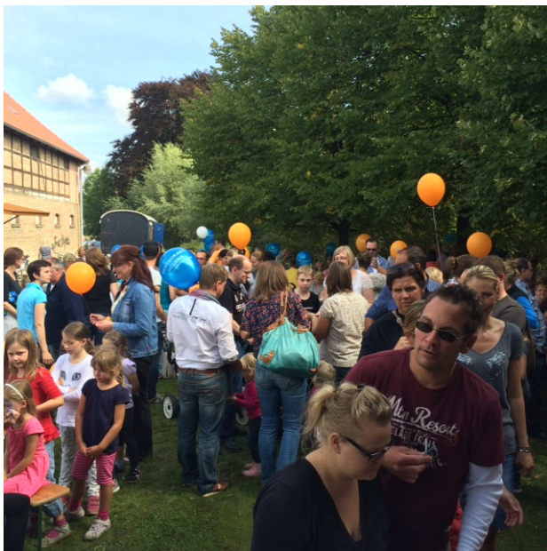
Blauer Himmel und großer Andrang beim 11. Sickter Entenrennen